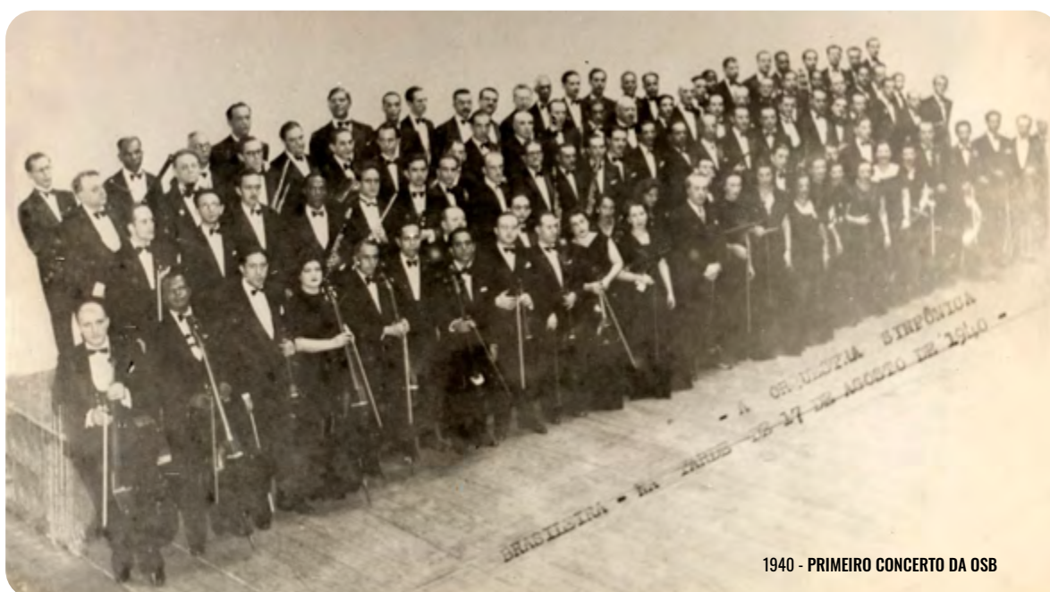
1940 - PRIMEIRO CONCERTO DA OSB

O Rio de Janeiro ainda era a capital da república quando, em 1940, nasceu a Orquestra Sinfônica Brasileira. Hoje, quase 82 anos depois, o conjunto permanece sediado na Cidade Maravilhosa, mas, desde então, muita coisa aconteceu: a capital foi transferida para Brasília, e a orquestra, por sua vez, se consagrou como o mais tradicional conjunto sinfônico do país, reconhecida como patrimônio cultural brasileiro. Em sua extensa e exitosa atividade artística, a OSB acumula milhares de apresentações em palcos do Brasil e do exterior, nas mais prestigiosas salas de concerto do mundo. A lista de artistas que já se apresentaram com a orquestra é de alto escalão: Eleazar de Carvalho, Igor Stravinsky, Leonard Bernstein, Kurt Masur e Lorin Maazel são apenas alguns dos maestros que assumiram a batuta da OSB. A relação de solistas que tocaram ao lado da orquestra é igualmente impressionante e inclui nomes como Arthur Rubinstein, Martha Argerich, Plácido Domingo, José Carreras, para citar apenas alguns.